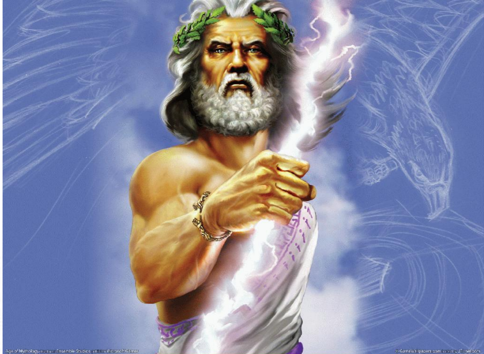
Age of Mythology artwork by Ensemble Studios published by Microsoft Games